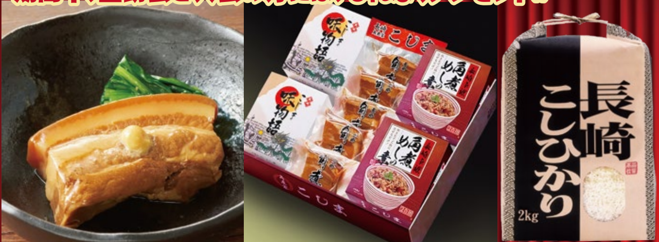
※写真は、イメージです。パッケージが異なる場合がございます。