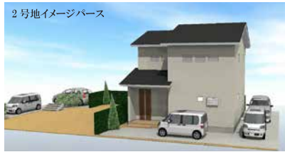
2号地イメージパース

※上記プランは一例であり、実際の建築を計画しているものではありません。プラン・仕様は自由に選定いただけます。