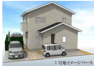
1号地イメージパース