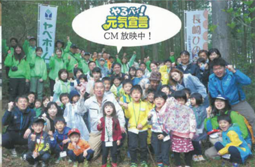
ヤベホームの森（長崎市松崎町） 2019年4月 カーボンオフセット森林ツアーにて